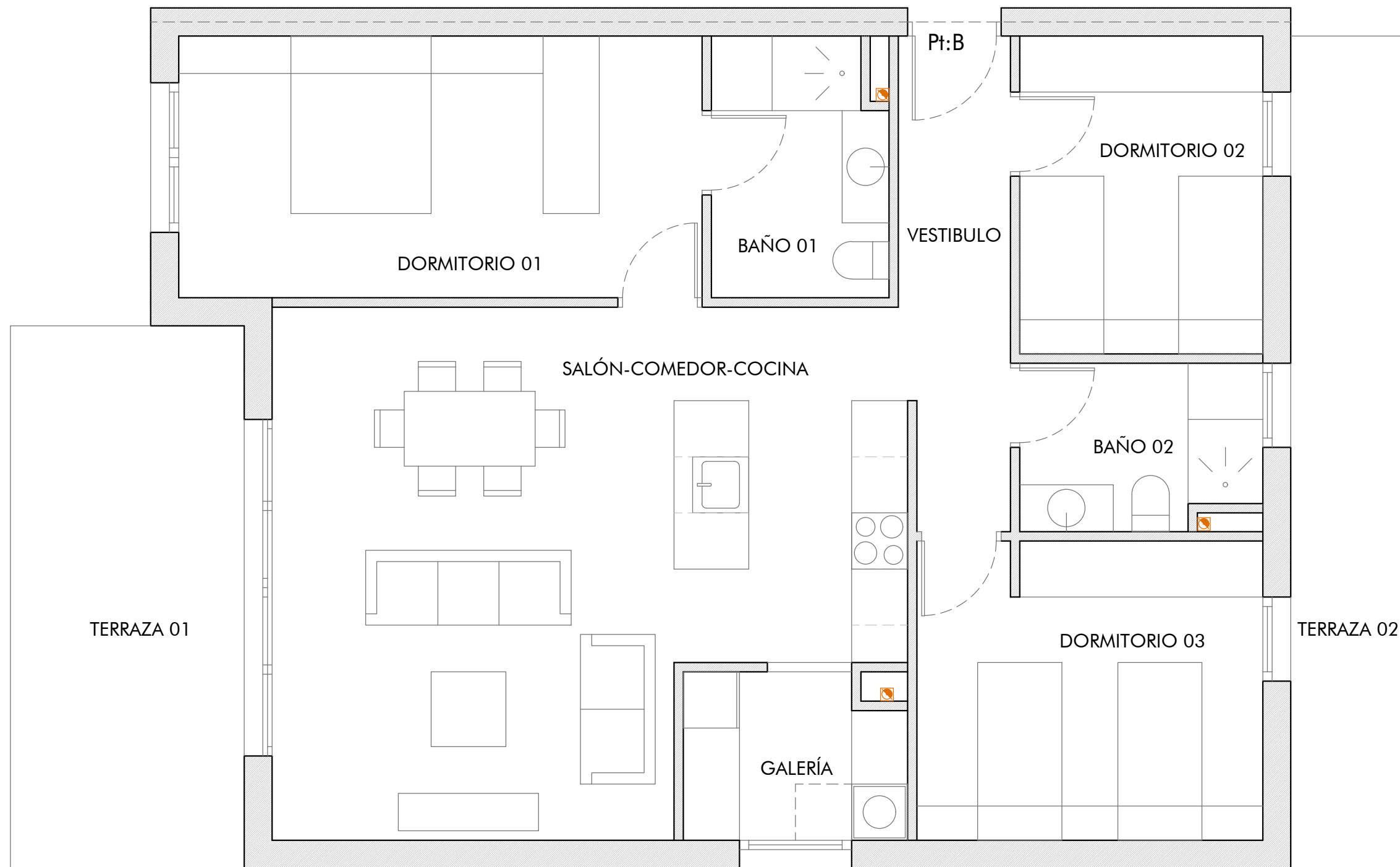
Pt: B, Pl: 01-02-03-04-05